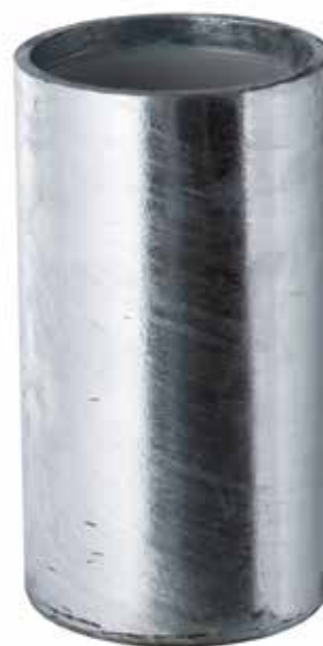
Modelo de la imagen: 8000089